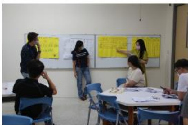
領域成員小組互評與分享