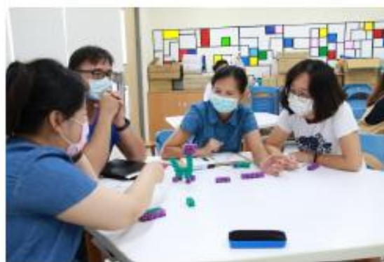
領域成員小組討論