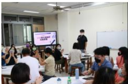
學年會議主席致辭