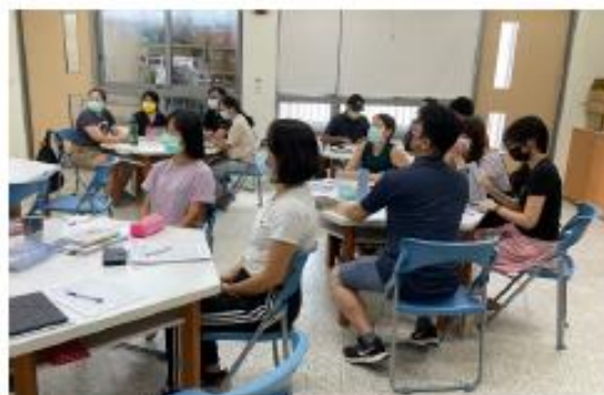
全校教師出席學年會議