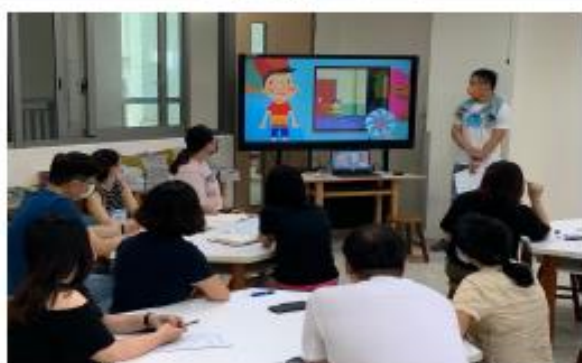
各領域重點報告及議題討論