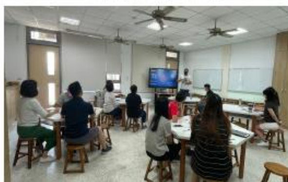
各領域重點報告及議題討論